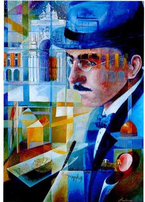
Homenagem a Fernando Pessoa Luís Badosa, 1997